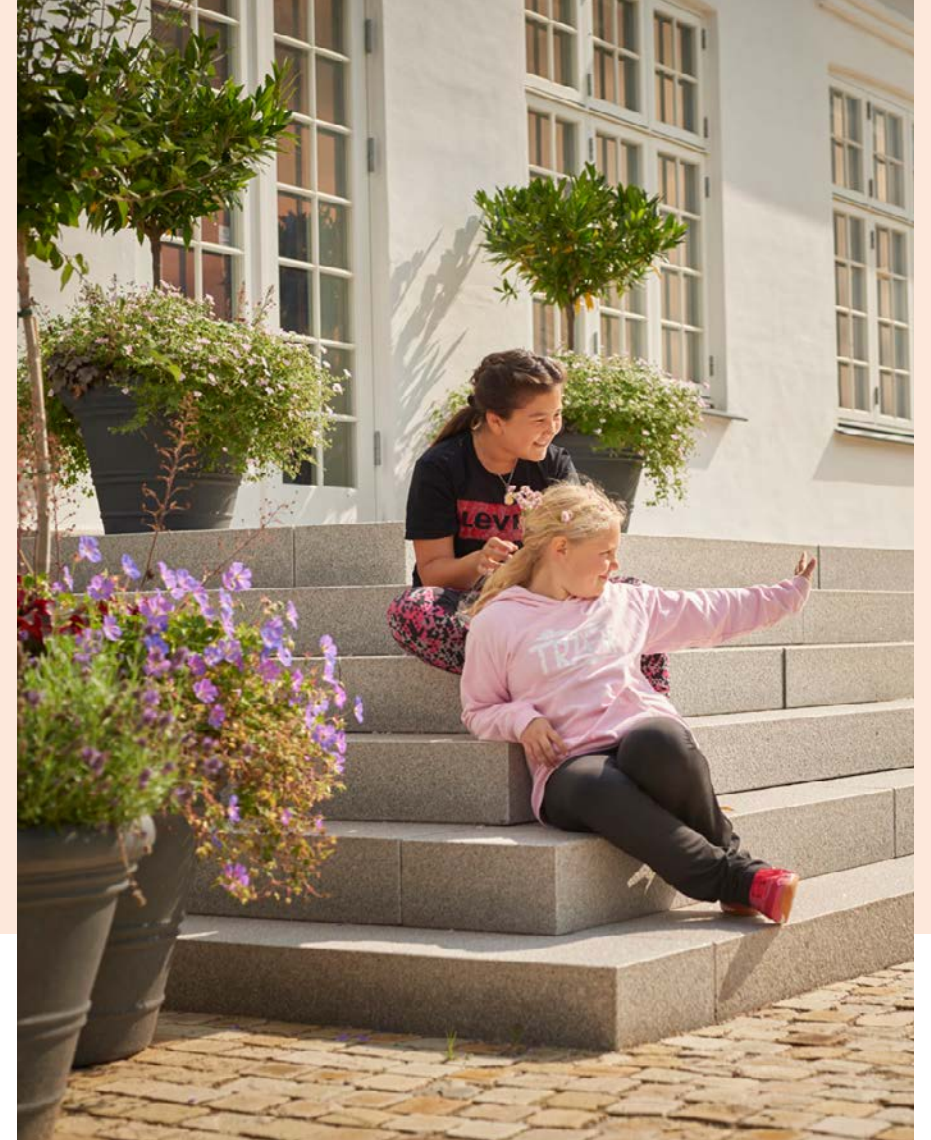
Julmærkehjemmet Liljeborg i Roskilde.

Liljeborgfonden vil udfolde sine erhvervs-mæssige almennyttige aktiviteter, blandt andet i form af flagskibsprojekter. Det vil vi for at kunne tilbyde udvalgte organisationer stabile fysiske rammer i høj kvalitet til en realistisk og overkommelig husleje. Ønsket er, at dette kan bidrage til en øget driftssikkerhed og ro til at fokusere på målgruppens behov og på udvikling af organisationens økonomiske og organisatoriske bæredygtighed.